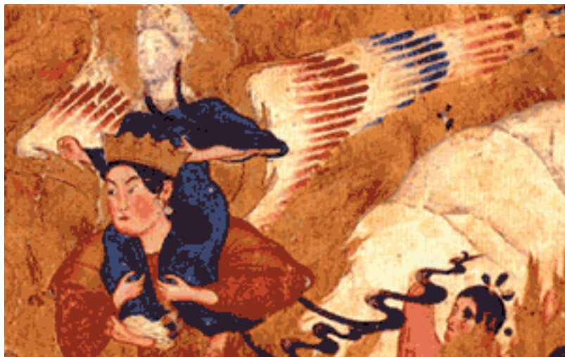
Muhammed portrætteres oftest uden ansigt eller med et klæde for ansigtet, men der er undtagelser. Dette udsnit af en miniature fra det 14. århundrede viser Muhammeds himmelfart, hvor ærkeenglen Gabriel bærer ham over Miraj-nama bjergene. Billedet findes i Topkapi Paladset i Istanbul.